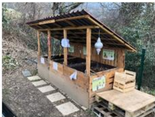
Parking du Coin